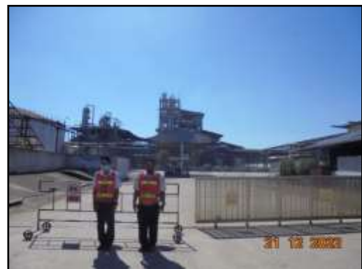
รูปที่ 2-24 เจ้าหน้าที่รักษาความปลอดภัย ภายในพื้นที่โครงการ