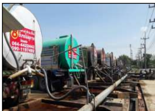
รูปที่ 2-13 รถบรรทุกขนส่งน้ำกากส่า