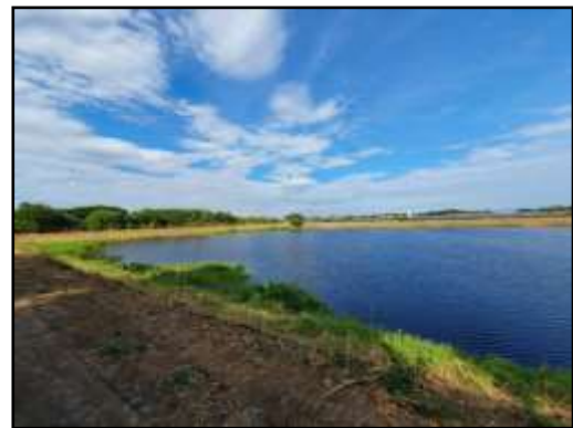
รูปที่ 2-21 ป่อนกวนน้ำ ของโครงการ