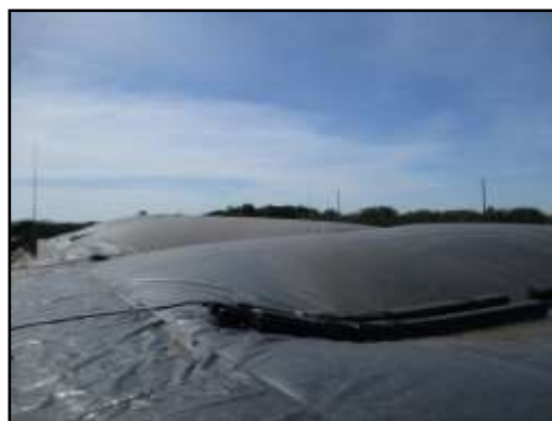
รูปที่ 2-3 ระบบบำบัดน้ำเสียของโครงการ