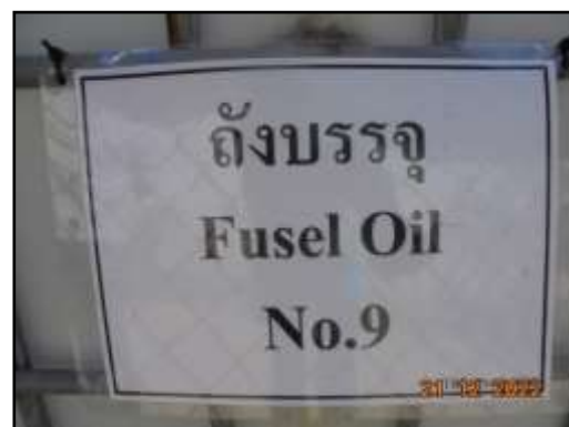
รูปที่ 2-10 ถังเก็บฟูเซลอยล์