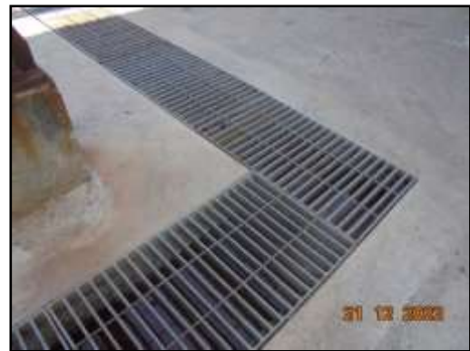
รูปที่ 2-17 รางระบายน้ำฝนรอบพื้นที่โครงการ