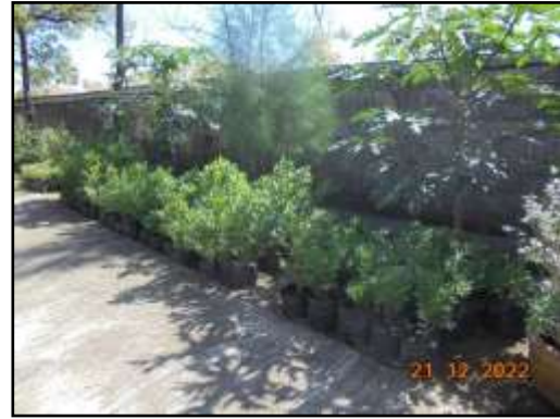
รูปที่ 2-33 เรือนเพาะชำและแปลงอนุบาลกล้าไม้ เพื่อเพาะพันธุ์กล้าไม้ สำหรับปลูกทดแทนในบริเวณพื้นที่สีเขียว