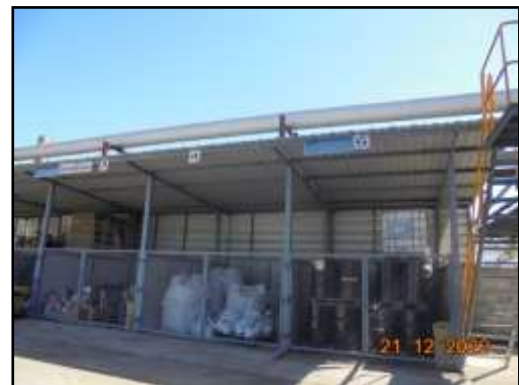
รูปที่ 2-29 พื้นที่เก็บขยะมูลฝอยหรือสิ่งปฏิกูลและวัสดุที่ไม่ใช้แล้ว