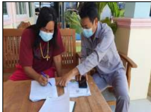
รูปที่ 2-30 การประชาสัมพันธ์ให้ความรู้ด้านต่างๆ แก่ชุมชนในพื้นที่