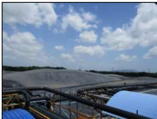
รูปที่ 2-4 พลาสติก HDPE ปิดคลุมบ่อพักน้ำเสียของโครงการ