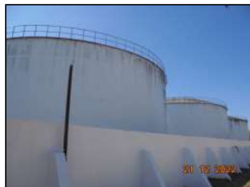
รูปที่ 2-34 คันคอนกรีตล้อมรอบถังเก็บเอทานอล