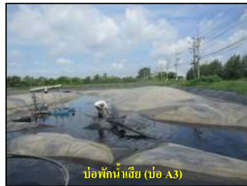
รูปที่ 2-5 บ่อพักน้ำเสียของโครงการ