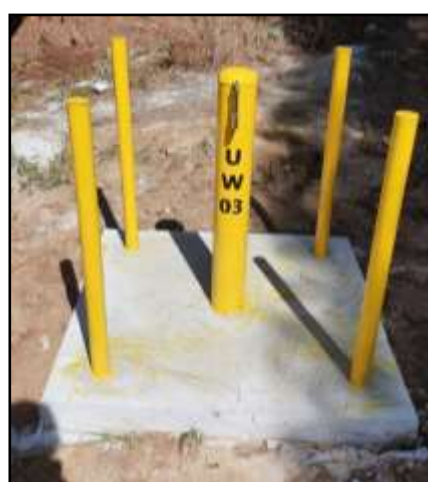
รูปที่ 2-19 ป่อสังเกตการณ์ (Monitoring Well) บริเวณพื้นที่โครงการ