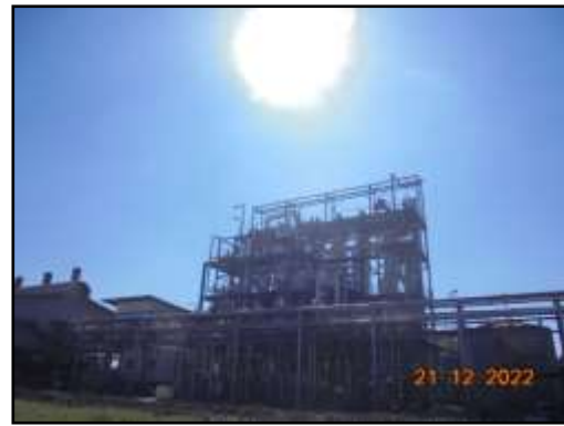
รูปที่ 2-9 ถังหมัก หอกลิ้น และหอกลั่นน้ำที่เป็นระบบปิด