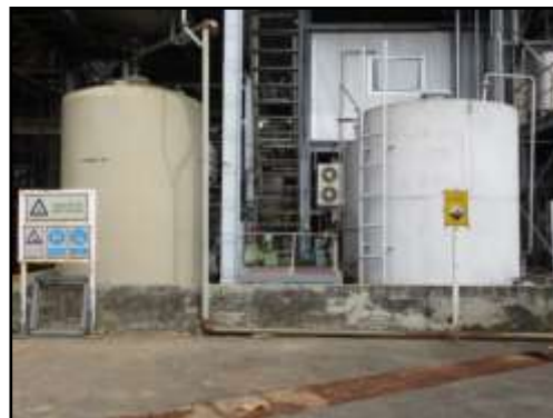
รูปที่ 2-40 ถังเก็บ H 2 SO 4