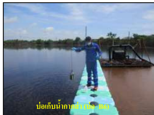
รูปที่ 2-6 บ่อเก็บน้ำกากส่าของโครงการ