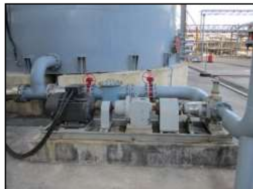
รูปที่ 2-37 ปัมป์สูบลกากน้ำตาล