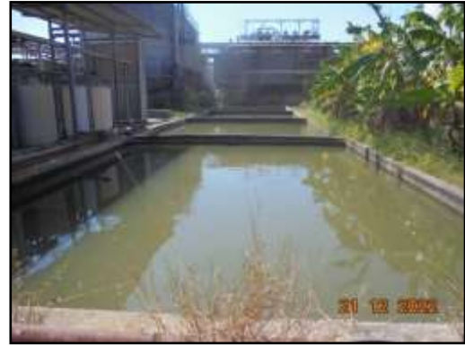
รูปที่ 2-23 บ่อพักน้ำดิบภายในพื้นที่โครงการ