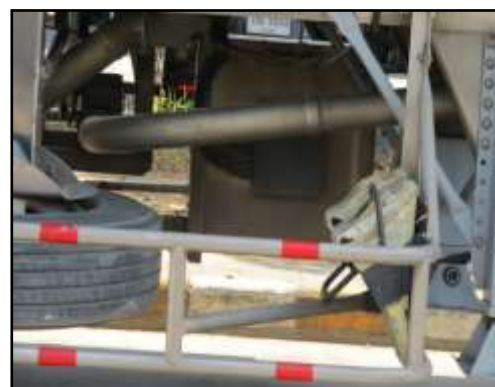
รูปที่ 2-27 อุปกรณ์ดับเพลิงในรถบรรทุกที่ใช้ภายในโครงการ