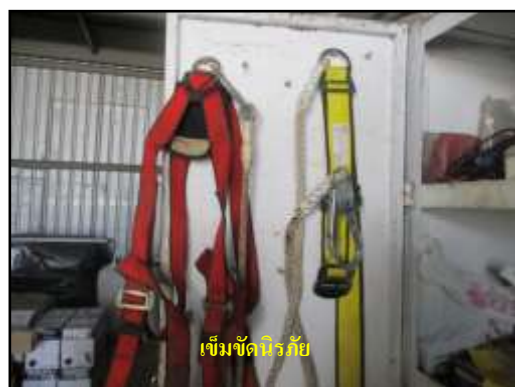
รูปที่ 2-16 อุปกรณ์ป้องกันอันตรายส่วนบุคคลสำรอง