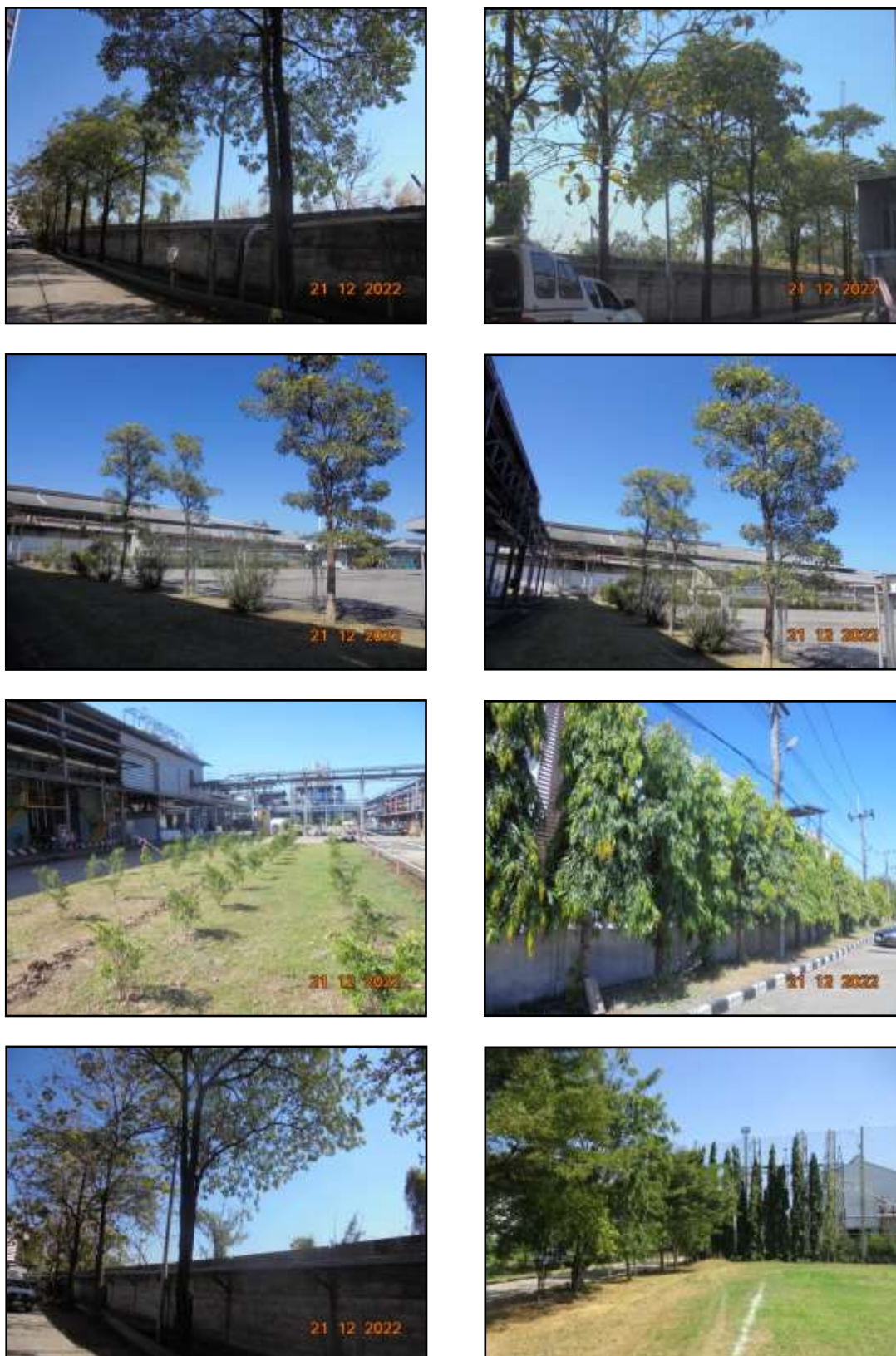
รูปที่ 2-31 พื้นที่สีเขียวโดยรอบโครงการ