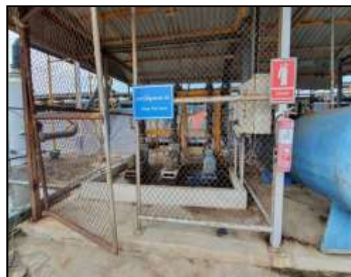
รูปที่ 2-8 อาคารปั๊มสุบตะกอน