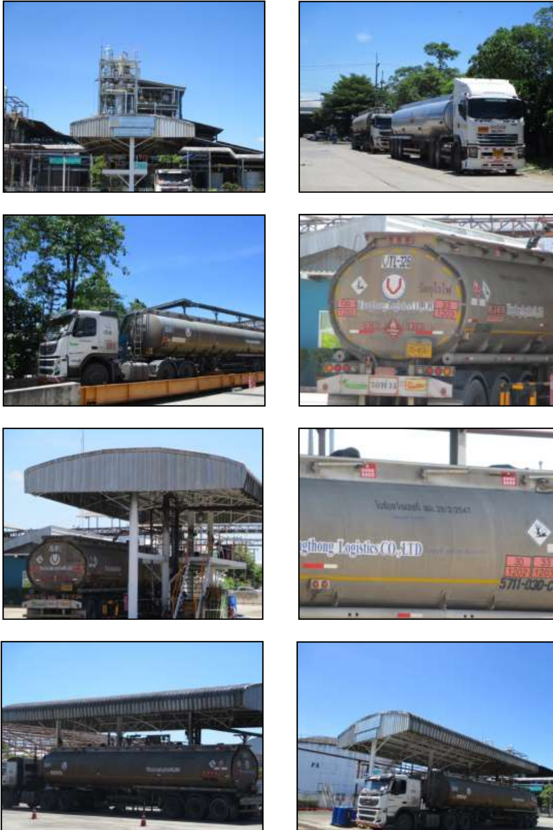
รูปที่ 2-12 รถบรรทุกขนส่งเอทานอล