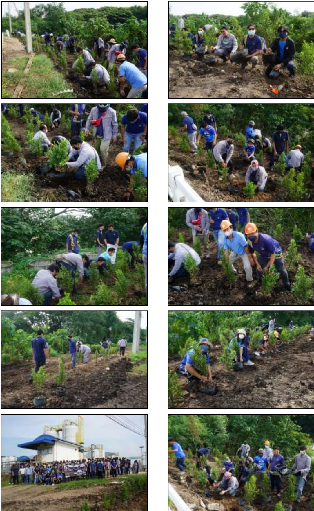
รูปที่ 2-32 การปลูกต้นไม้ยืนต้น โดยรอบโครงการและบริเวณด้านประชิดแม่น้ำป่าสัก