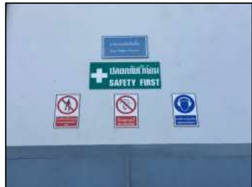
รูปที่ 2-14 ป้ายเตือน ให้สวมใส่อุปกรณ์ป้องกันอันตรายขณะปฏิบัติงาน