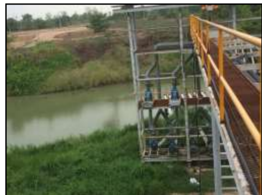
รูปที่ 2-22 สถานีสูบน้ำดิบแม่น้ำป่าสัก