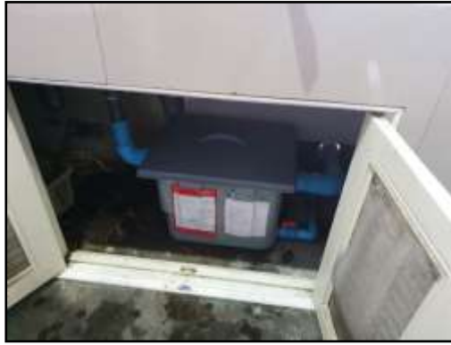
รูปที่ 2-20 ถังดักไขมันในโรงอาหาร