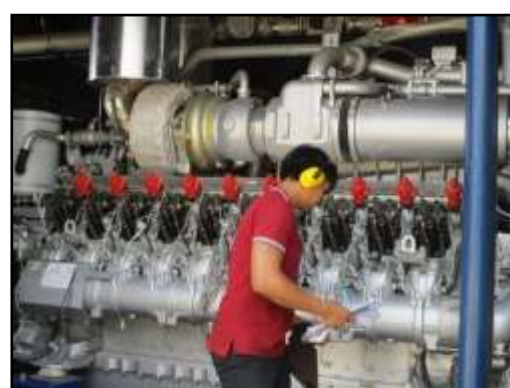
รูปที่ 2-15 พนักงานสวมใส่อุปกรณ์ป้องกันอันตรายส่วนบุคคลขณะปฏิบัติงาน