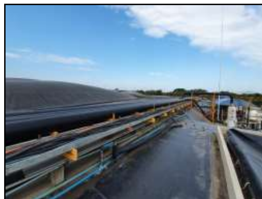
รูปที่ 2-7 บ่อหมักของระบบผลิตก๊าซชีวภาพ ของโครงการ