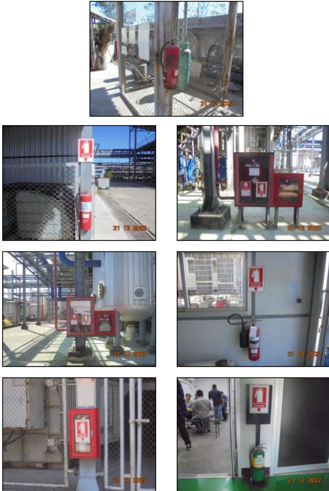
รูปที่ 2-41 ถังดับเพลิงภายในพื้นที่โครงการ