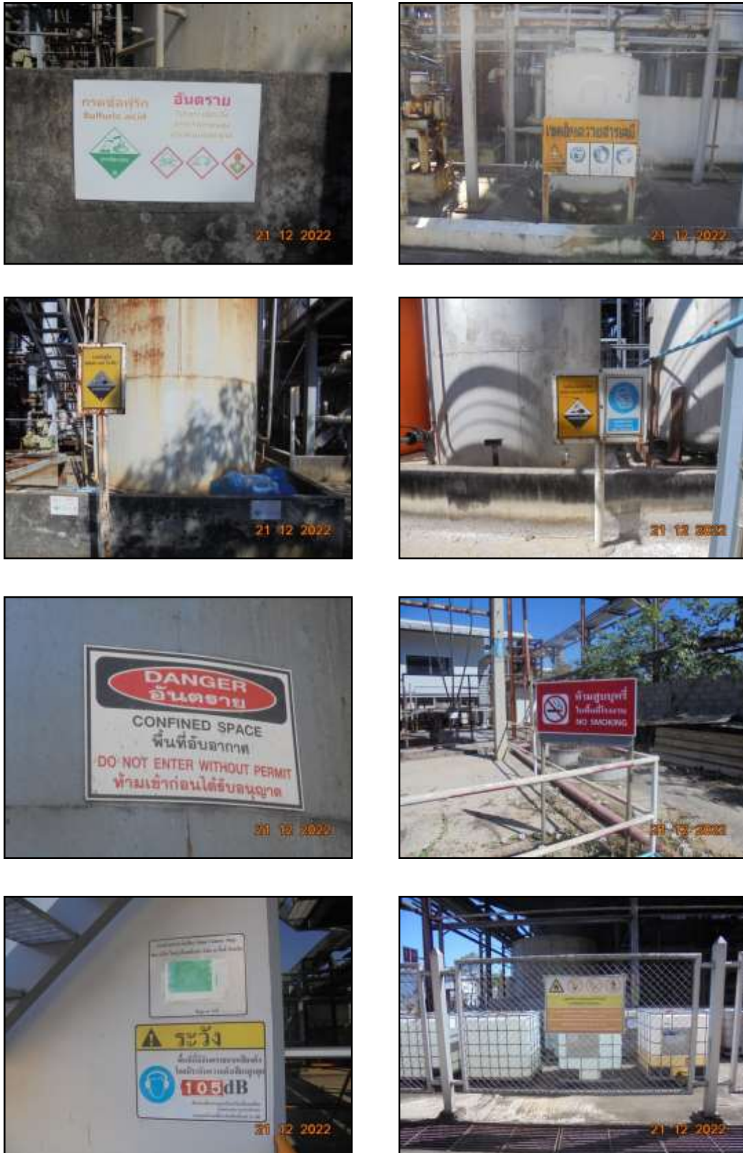
รูปที่ 2-26 ป้ายเตือนต่างๆ ภายในพื้นที่โครงการ