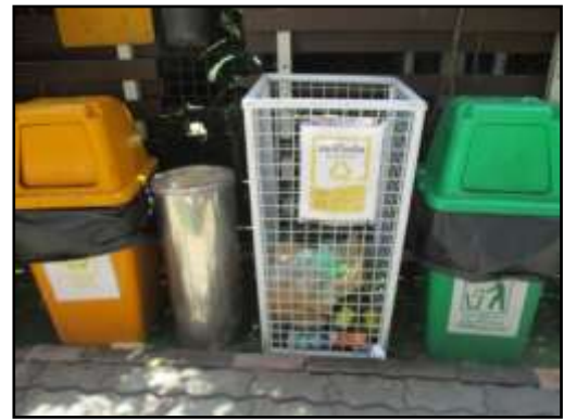
รูปที่ 2-28 ฉายภายในโครงการ