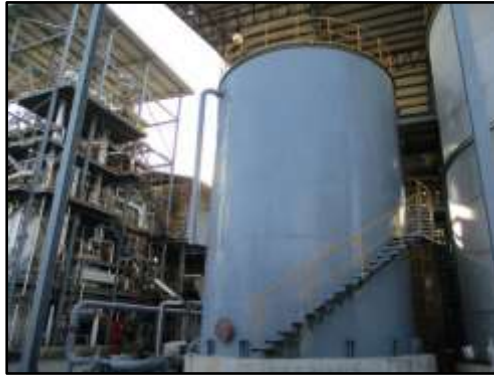
รูปที่ 2-36 ถังเก็บกากน้ำตาล