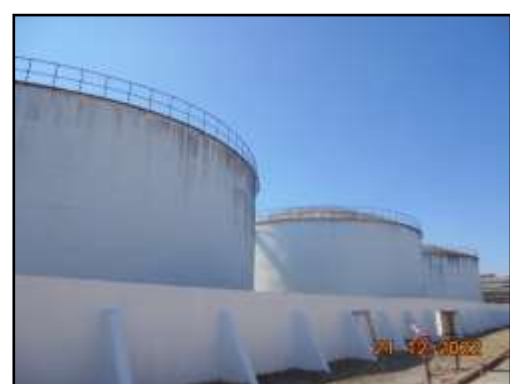
รูปที่ 2-11 ถังเก็บเอทานอล