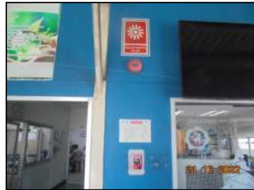
รูปที่ 2-42 ระบบป้องกันและระงับอัคคีภัยภายในพื้นที่โครงการ