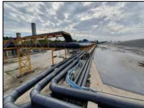
รูปที่ 2-38 ท่อที่ใช้ในการลำเลียงก๊าซชีวภาพของโครงการเป็นท่อ HDPE PE100/PN10