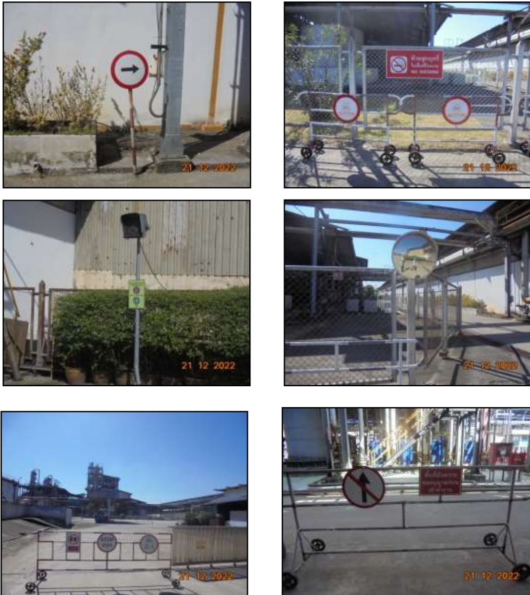
รูปที่ 2-25 สัญญาณจราจรภายในพื้นที่โครงการ