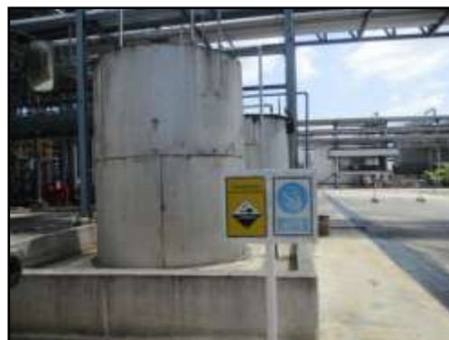
รูปที่ 2-39 ถังเก็บ NaOH