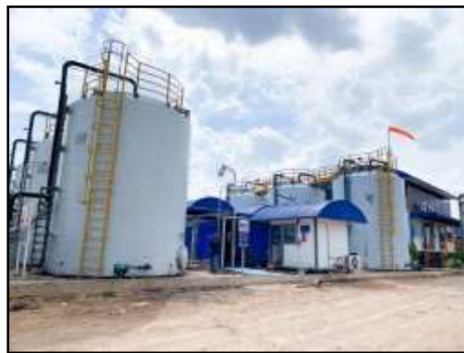
รูปที่ 2-2 ระบบ Bio scrubber ของโครงการ