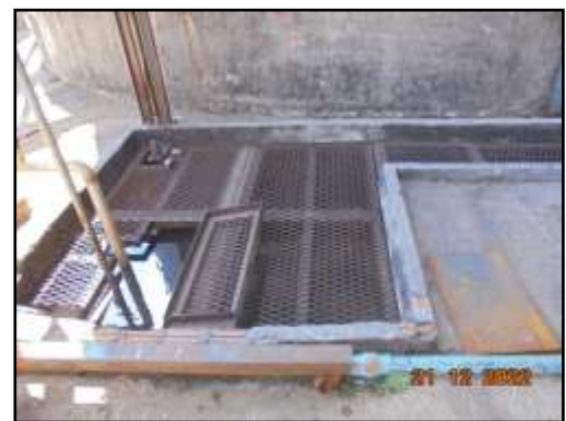
รูปที่ 2-18 รางระบายน้ำเสียภายในพื้นที่โครงการ