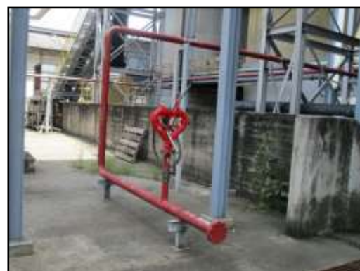
รูปที่ 2-35 ท่อน้ำดับเพลิงโดยรอบพื้นที่ส่วนผลิตและถังเก็บเอทานอล